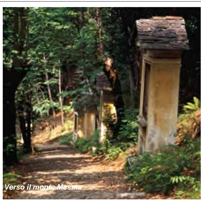
Verso il monte Mesma

si prosegue in discesa nel bosco attraversando un paio di volte un affluente dell'Agogna (m. 410), la seconda su un ardito “ponte canale”, che serviva la vecchia fucina, i cui ruderi sono ancora visibili per poi inoltrarsi nella valle boscosa se- guendo il corso dell'Agogna. Per car- rareccia prima e poi per sentiero si risale prima alle case diroccate di Tacchino (m. 585) e poi alla località Sculera (m. 650) con la seicentesca Chiesetta di Santa Eurosia. La sali- ta prosegue nel bosco fino all'ampia radura dei pascoli dell'Alpe Malandino (m. 740, ore 3) dove ci si fermerà per la pausa pranzo. Il paesaggio si apre sull'ampio anfiteatro di monti tondeggianti, co- perti da boschi e prati, che fanno corona al Mottarone, con la sagoma spoglia del Monte Falò in bella evi- denza. Il verde è interrotto solamente dai modesti abitati di