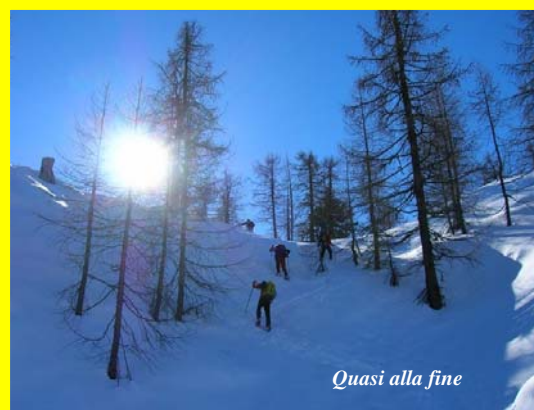
Quasi alla fine

e di larice nella parte alta intercalati a prati e pascoli. Passando per gli alpeggi di Rausa di Bannio e di San Carlo si arriva ad una prima cima che è collegata al Pizzetto da una facile cresta in parte ricoperta da larici. La discesa avviene per lo stesso itinerario