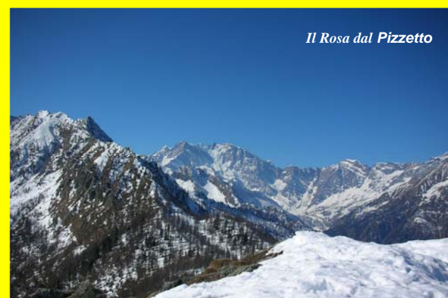
Il Rosa dal Pizzetto