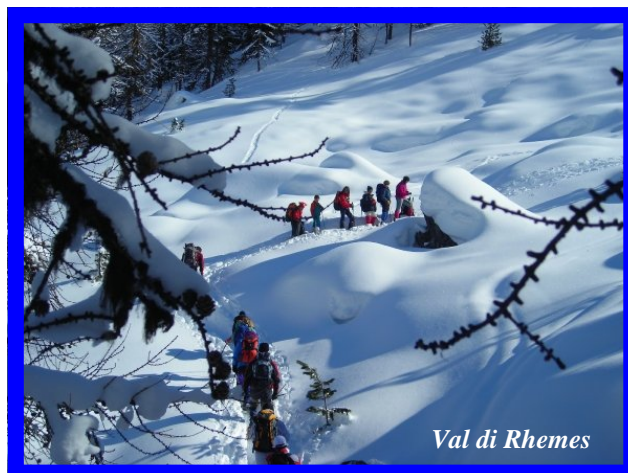
Val di Rhemes

Le iscrizioni si prendono in sede nelle serate di apertura e come di consueto via e-mail.