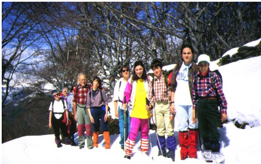
Salita all'Alpone (Val Dumentina)