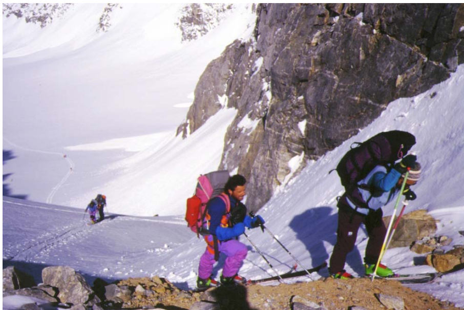
Col de la Grande Casse (Vanoise) - giugno 97