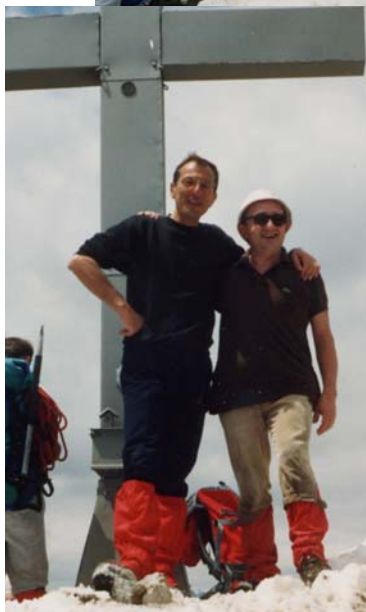
Il CAI Varese al CIMON della BAGOZZA nel maggio 1991