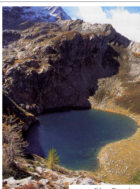
Il lago Trescolmen

Mezzo di trasporto: Treno - Pulman Programma di massima: 1° giorno: Thuras (Alta Valsusa 1948 m) - Colle Thuras (2798 m) - Le Roux (1733 m) 2°