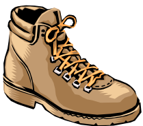
La pagina di DvV

Il momento positivo per il Gruppo Senior è proseguito anche durante il mese di Maggio. Dopo la gita culturale alla Sacra di San Michele nella Val di Susa abbiamo fatto la traversata dal Passo Premia a Formazza, l'incontro culinario di primavera a Castello Cabiaglio, la camminata da Morcote al Monte San Salvatore ed il Raduno Regionale dei Soci Anziani (orribile questa denominazione) al Piano di Resinelli. Un programma pesante di cinque gite consecutive, però tutte si sono svolte con grande successo e con partecipazione massiccia. L'unica volta che pioveva era durante il pranzo