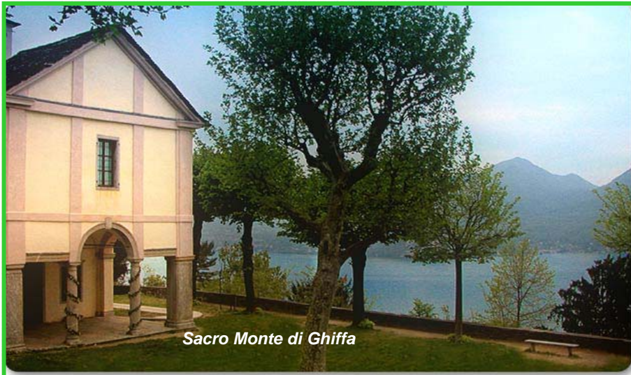
Sacro Monte di Ghiffa

hanno perfettamente restaurato nel 2008. Salendo sempre tra testimonianze della prima guerra mondiale, si raggiunge il punto più elevato della gita, la vetta del Sasso di Cavallasca, dove c'è un punto panoramico con veduta su Como ed il suo lago. Si scende, sempre tra resti di trincee, si passa per un nuovo punto panoramico rivolto verso la pianura, si lascia sulla destra un agriturismo, e si ritorna al posteggio dove erano state lasciate le auto.