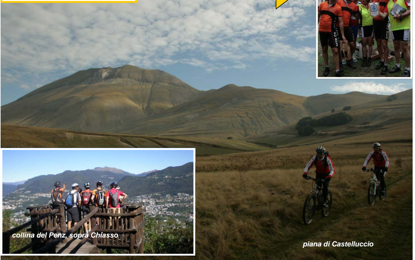
collina del Penz, sopra Chiasso