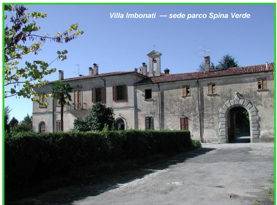
Villa Imbonati — sede parco Spina Verde