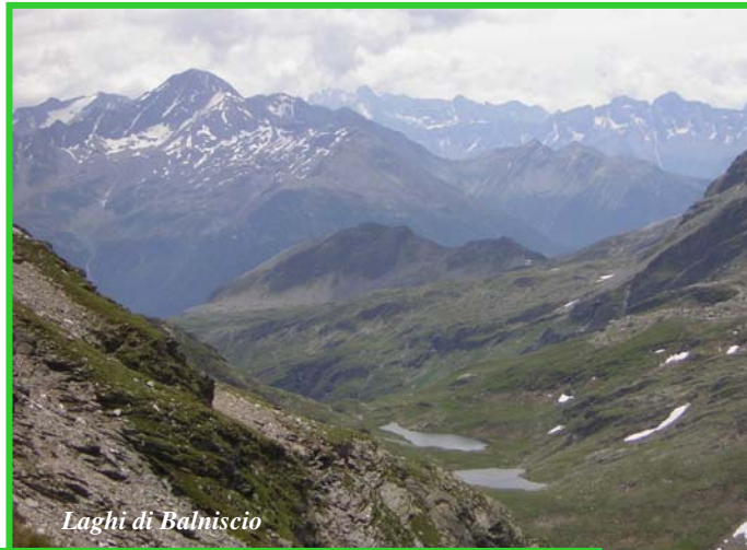
Laghi di Balniscio

dislivello in salita m. 1173; in discesa idem tempi di percorrenza : in salita ore 4,0; in discesa ore 3,0 L'escursione parte dal Pian San Giacomo m.